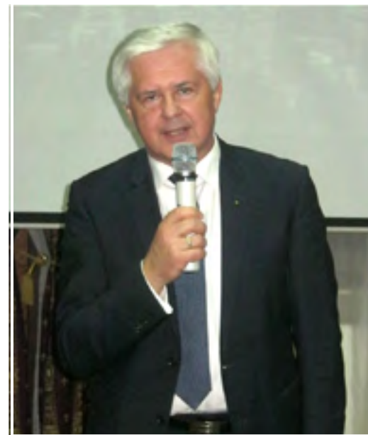
Генконсул Литвы Витаутас Умбрасас

Со словами поздравления в адрес Еврейской общины выступили присутствующие в зале Исполняющий обязанности Генераль-