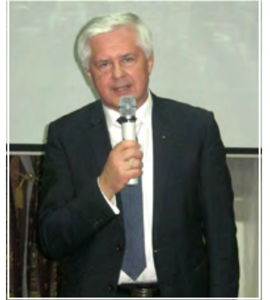
Генконсул Литвы Витаутас Умбрасас

Со словами поздравления в адрес Еврейской общины выступили присутствующие в зале Исполняющий обязанности Генераль-