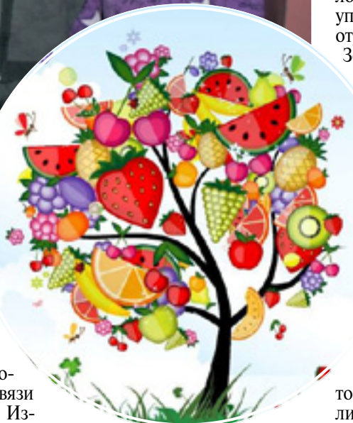
Одно из первых описаний такого седера мы находим в книге «Хемдат а-ямим»: «В ночь на Ту би-шват собираются в доме уче-

крытых снегом, было трудно ощутить праздничную атмосферу. Поэтому неудивительно, что, когда почти весь еврейский народ оказался в диаспоре, о празднике Ту би-шват забыли на много столетий. Только в XVI веке о нем вспомнили цфатские каббалисты, и для них этот день стал праздником, напоминающим о мистической связи еврейского народа с Землей Израиля. В этих же кругах возник обычай устраивать в этот день специальную праздничную трапезу — Седер Ту би-шват, по аналогии с пасхальным седером.