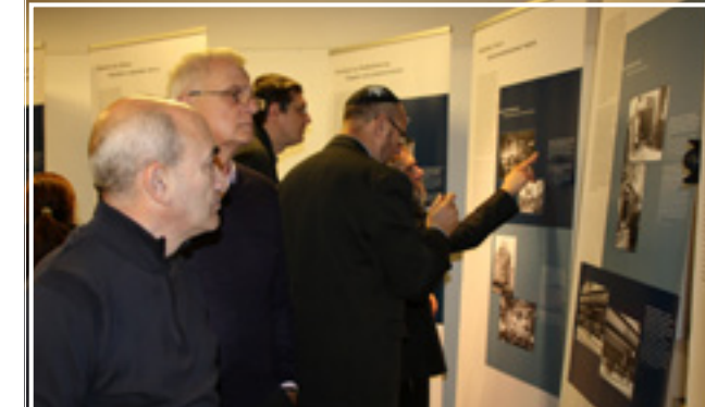
Окончание. Начало на странице 1 и 3.

Ранее эта книга была издана в Германии, но теперь исследователи того периода смогли познакомиться с биографическим памятником и на русском языке. В ближайшем номере газеты Симха мы расскажем об этом более подробно.