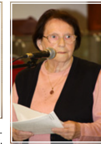
Окончание. Начало на странице 1 и 3.

народа. Но главное, все выступающие говорили о том, что историю прошлого нельзя забывать, на ней надо учиться и делать выводы.